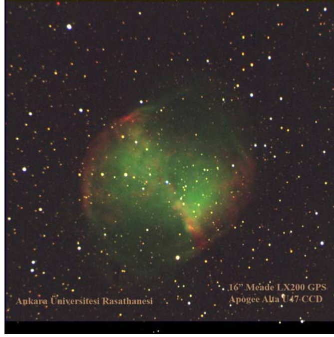
Şekil 3. Dumbbell Bulutsusunun (M27) Kreiken Teleskobu ile Temmuz 2007'de alınmış RGB görüntüsü.