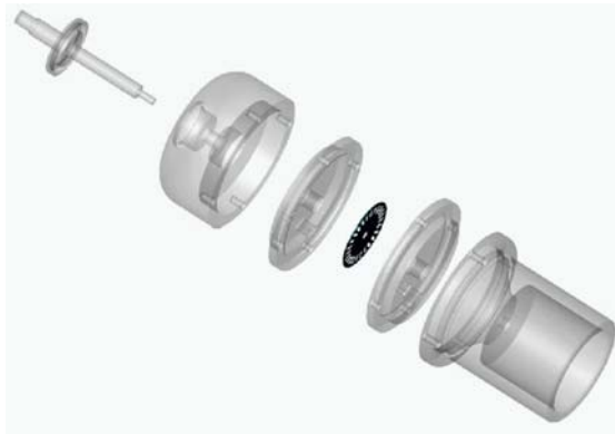
Şekil 2. Fiber tabanlı dönel kodlayıcılara ait bilgisayar destekli çizim yazılımı çıktısı

Sensörde kullanılan fiber kablolar, hem sensör diskinin desenini aydınlatma amaçlı, hem de