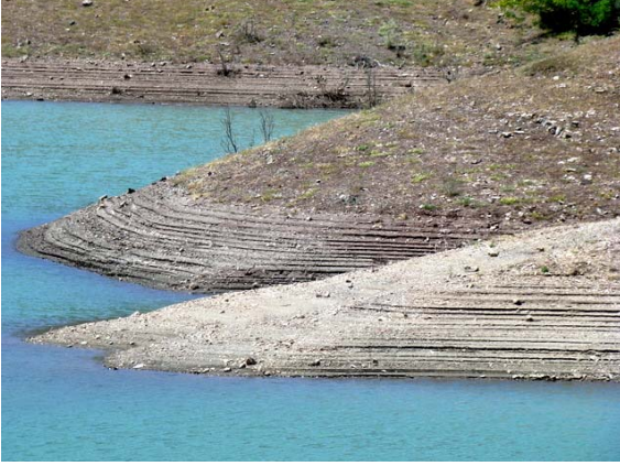
Yukarı Gökdere göleti

Akpınar köyü, Eğirdir gölüne hâkim bir noktada. Köyün seyirlik terasında içinde soğuk ayran içip gözleme yiyeceğimizi umduğumuz yörük çadırları, bürokratik süreçten dolayı maalesef henüz kurulu değil! Kıl çadır yerine köylülerin hazırladığı gözlemeleri köy evinin bahçesinde yiyip köy ayranı içiyoruz.