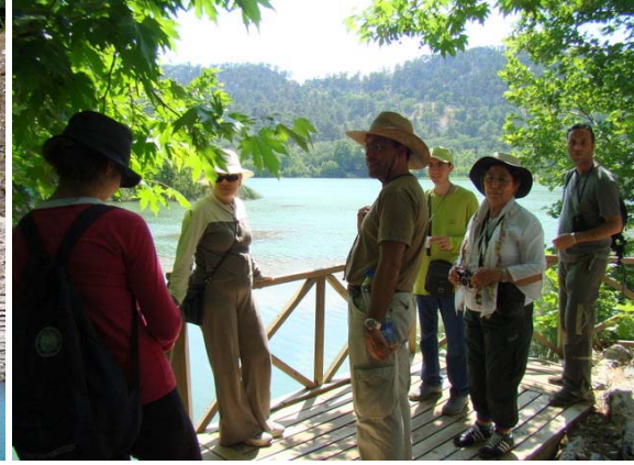
Kovada Milli Parkı

Tepeden Eğirdir'i ve sonrasında da Akpınar köyünün içini dolaşarak köylülerle sohbet edip etrafı fotoğraflıyoruz. Fazla zaman kaybetmeden buradan ayrılarak kasnak meşelerinin bulunduğu Yukarı Gökdere köyüne gidiyoruz. Yukarı Gökdere köyünden asırlık kasnak meşelerinin olduğu Kasnak Meşesi Orman Parkı'na giden yol dik ve toprak olduğundan gitmekten vazgeçiyoruz. Bu bölgede, buraya endemik olan kasnak meşesi ( Quercus Vulcanica ) bulunuyor. 1987 yılında koruma altına alınarak Kasnak Meşesi Tabiat Koruma Alanı olarak ilan edilmiş. Yarın Yazılıkanyon'a giderken yolumuzun üzerinde benzer ağaçlar göreceğimizi bildiğimizden bugün parka gidemeyişimize fazla üzülmiyoruz. Hazır buraya gelmiş iken köyün üst başındaki gölette kısa bir fotoğraf molası veriyoruz ve ardından Kovada Gölü Milli Parkı'na gitmek üzere buradan ayrılıyor. Yukarı Gökdere'den ayrılmadan önce köyün yakınındaki mesire alanındaki kaynak suyun olduğu parka giderek susuzluğumuzu gideriyoruz.