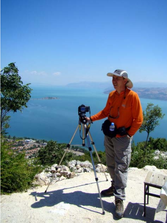
Akpınar köyünden Eğirdir

Sabah 07.30'da, Ankara'dan dün gece yola çıkan FSK gurubu ile geceyi geçireceğimiz Eğirdir Otel'de buluşuyorum. Odalarımız hazırlanırken otelde birlikte kahvaltı yapıyoruz, ardından odalarımıza yerleşiyoruz. Zaman kaybetmeden hazırlanıp saat 11.00'de otelden ayrılıyor, bugünkü ilk durağımız olan Akpınar köyüne aracımız ile gidiyoruz.